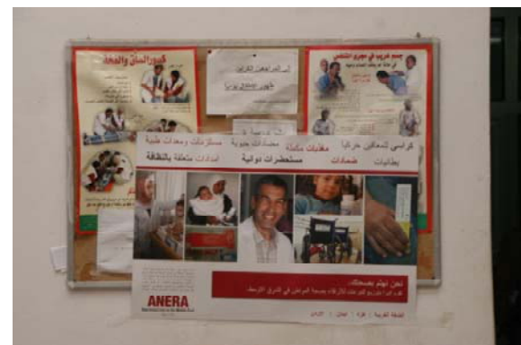
慢性疾患の管理、肥満対策のポスター(チャリティクリニック)